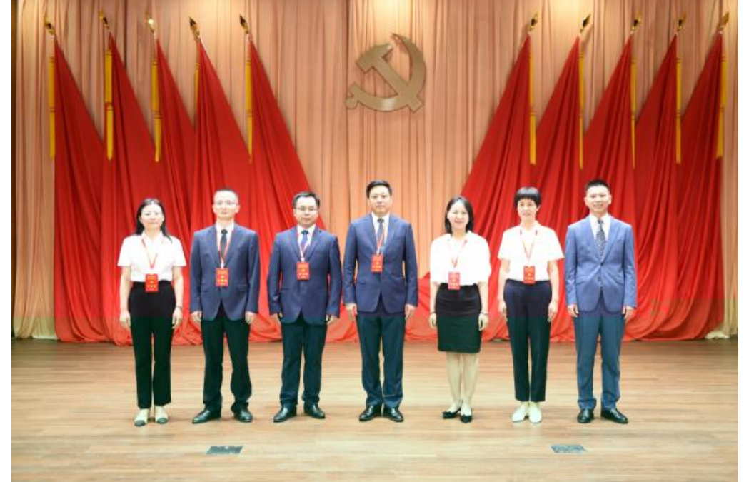
789: ; < = , > ? @ABCDE - F 5 - F