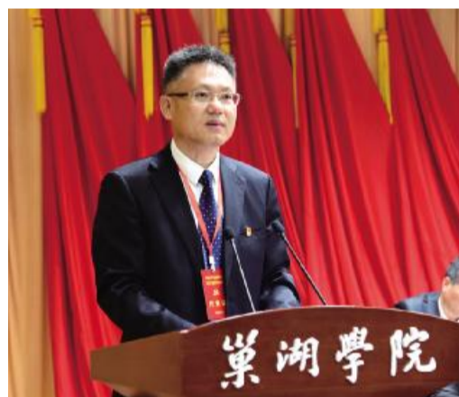
' ( ) * + , - . + / O