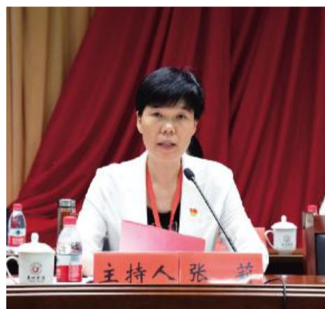
12) * 3456

夏荷过雨香满巢院,踔厉奋发再谱新篇。2022年6月28日上午,中共巢湖学院第三次党员代表大会在校求实报告厅隆重召开。 报告厅内气氛庄重热烈。大会主席台上方悬挂着“中国共产党巢湖学院第三次党员代表大会”的会标,十面鲜艳如火的党旗分列主席台两侧,正中簇拥着的金色党徽熠熠生辉。 中共安徽省委教育工委委员、安徽省教育厅副厅长张庚家,中共安徽省委组织部企事业干部处副处长胡德梅,中共安徽省委教育工委组织部副部长王树龙,中共安徽巢湖经济开发区工委副书记程习龙,中共巢湖市委常委、组织部长、统战部长张金平出席大会。中共巢湖学院第三次党员代表大会主席团成员在主席台就座。原厅级校领导代表、省级以上“两代表一委员”、民主党派巢湖学院基层组织负责人、不是党代表的正处级干部(含主持、负责工作的副处级干部)应邀参会。 本次大会应出席代表 123 名,实到代表 119 名,符合开会规定人数。