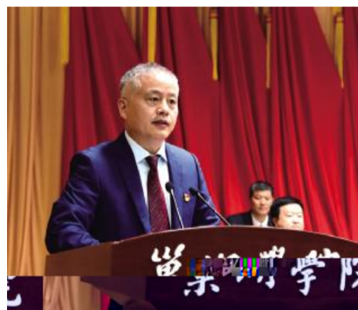
1GH) * I J K - LM. - , KLMNOP